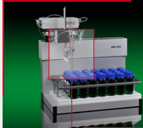
▲ APU 28 S